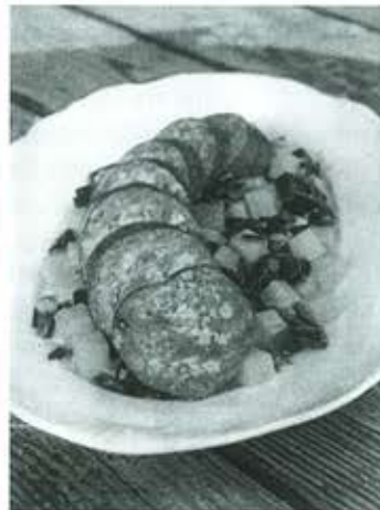
Le célèbre papet vaudois a aussi droit de cité au Vatican.