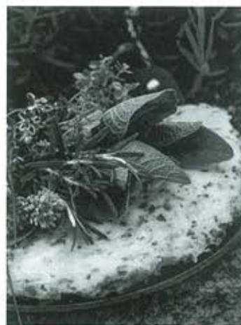
Omelette obwaldienne aux fines herbes.